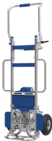
Saliscale elettrico DMEG170 con opzione estensioni laterali

Saliscale elettrico con chassis in alluminio e peso di soli 24 kg, di cui 3 di batteria intercambiabile. Dotato di timone regolabile e reclinabile, chassis e pianale di carico pieghevole in alluminio (mm 400x240), blocco motore con protezione IP54, protezioni ruote, batteria estraibile al litio, caricabatterie esterno, cinghia ferma-carico, ruote pneumatiche e doppia velocità di salita/discesa scale. Vari accessori disponibili.