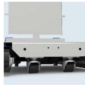
DME400 rulli pivotanti